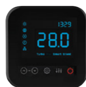
Pantalla táctil led de gran tamaño