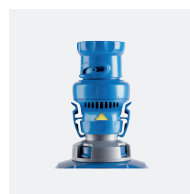
Regulador automático de caudal