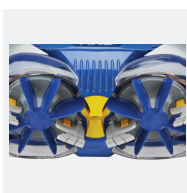
Cepillos de limpieza ciclónica