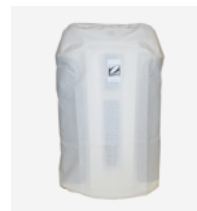
Funda de protección