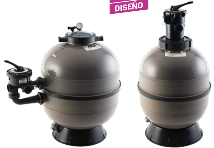
ProSeries™ HI Advanced Side