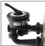
Válvula 6 posiciones Vari-Flo™