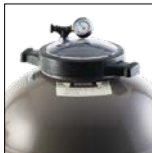
Cierre Twist Lock para una apertura más fácil