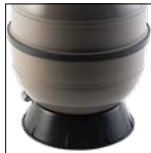
Base circular, para una estabilidad perfecta del filtro