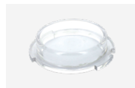
Tapón de invierno

Los cloradores salinos son una solución de desinfección automática y eficaz . Son fáciles de utilizar y se obtiene un tratamiento del agua completo y un mantenimiento reducido .