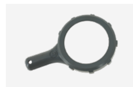
Llave apriete célula