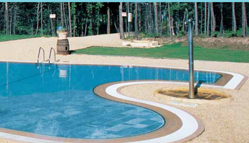
Ducha lavapiés Footwash shower