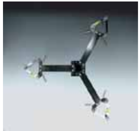
Tres duchas / Three shower heads