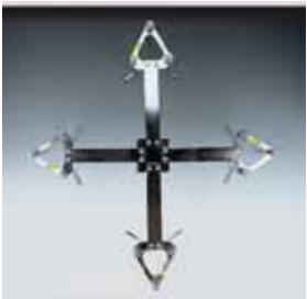
Cuatro duchas / Four shower heads